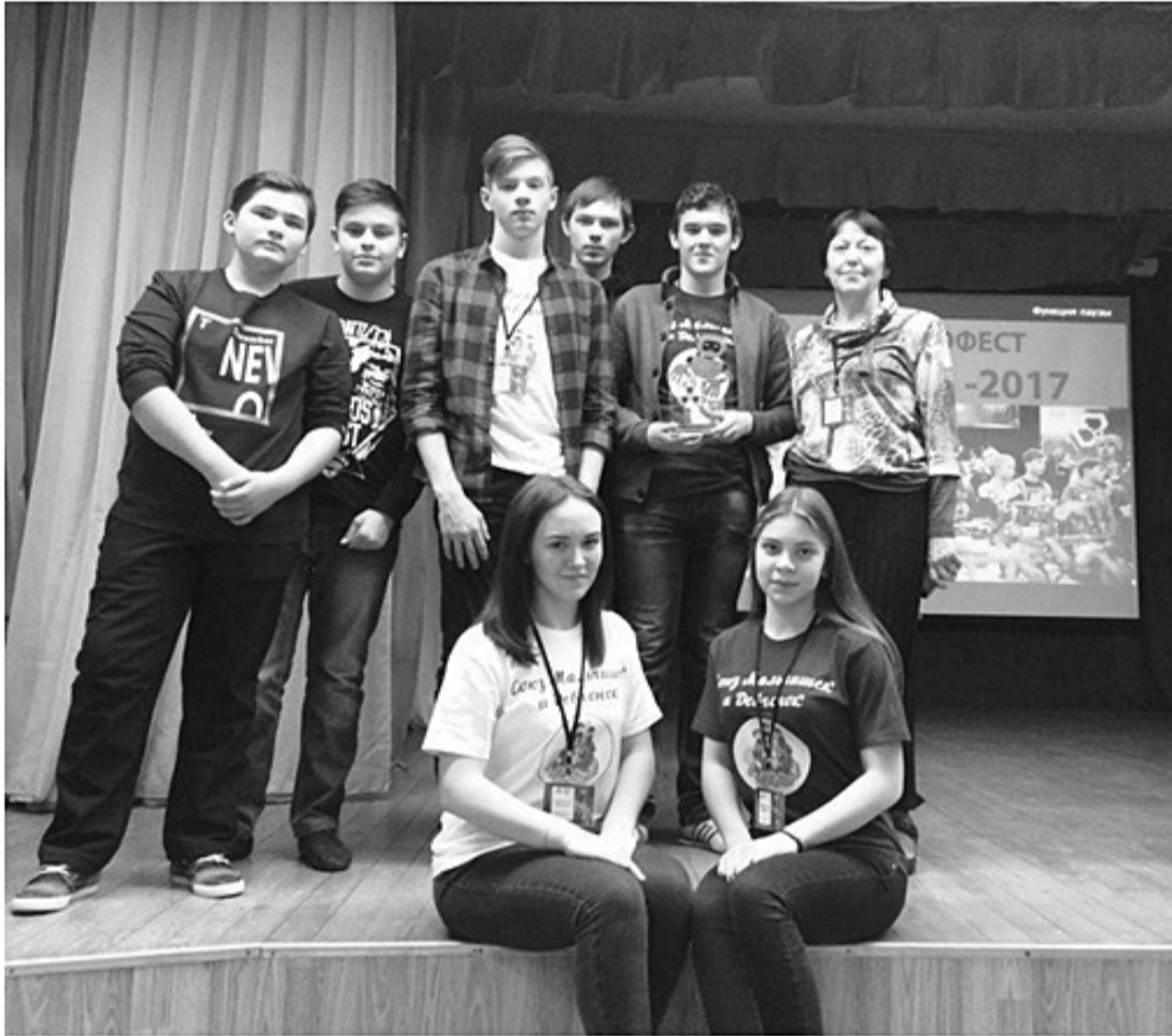
Вот они, победители вместе со своим тренером.

подготовить и принести всё необходимое для участия оборудование: робототехнические наборы, запасные части, программное обеспечение и портативные компьютеры.