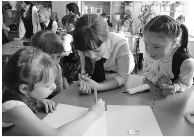
Муки творчества юнкоров.

- Придумывать имя для газеты - это дело всех жителей района. Но однозначно её имя должно быть связано с Сорокино, чтобы каждый, кто брал в руки нашу газету, видел, что