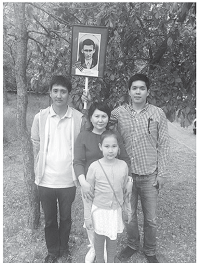
2. Элиста, 9 мая 2017 г.

Потомки сибиряков ещё раз напомнили нам рассказы родителей о тех, кто подставил плечо, кто поделился краюхой хлеба, кто угостил картошкой и кто дал приют и кров.