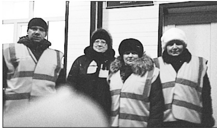
Сорокинские дружинники несут дозор на улицах села

например, так, что зима на подходе, а в семье нет дров. Мы стараемся оперативно решить эту проблему. Обязательно обсуждаем с родителями занятость их детей в каникулярное время, чтобы они не были предоставлены сами себе, предлагаем варианты организации детского досуга.