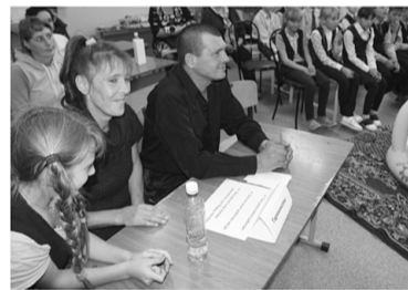
Семейная игра «И это моя семья» (рук. Е.В. Цыкунова) весело и с пользой прошла в Ворсихе.

готовке и проведению социальных дней, продуманность проводимых мероприятий.