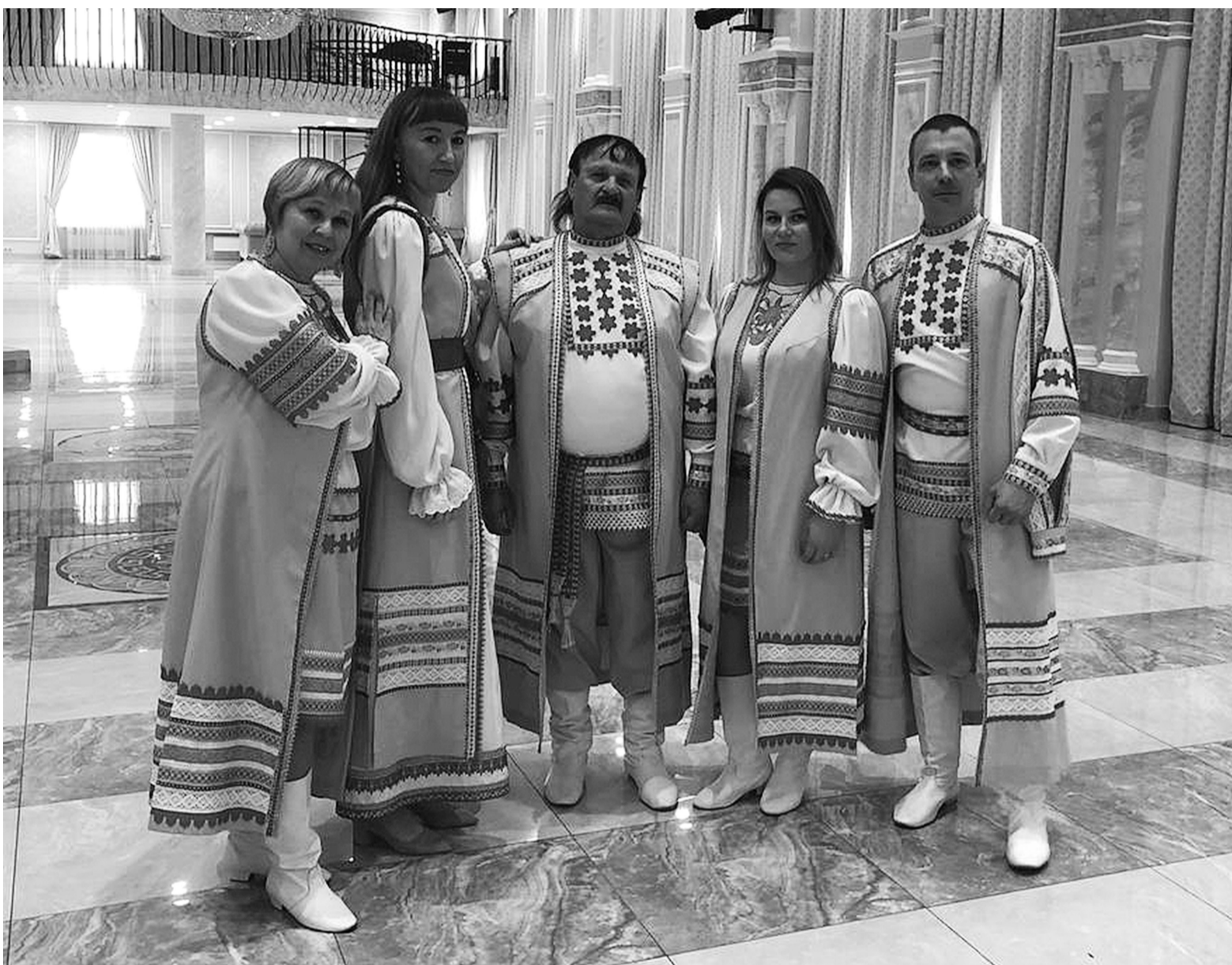
Народный любительский коллектив "Визит" известен далеко за пределами района.

Культура. 7 сентября в малом зале "Нефтяника" состоялась концертная программа "Кружева России"