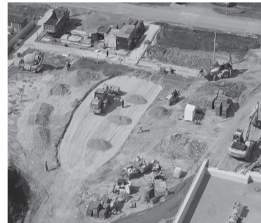
Совсем скоро у сорокинцев появится ЦКР

менской области. Я абсолютно уверена, что Центр культурного развития в селе Большое Соро-