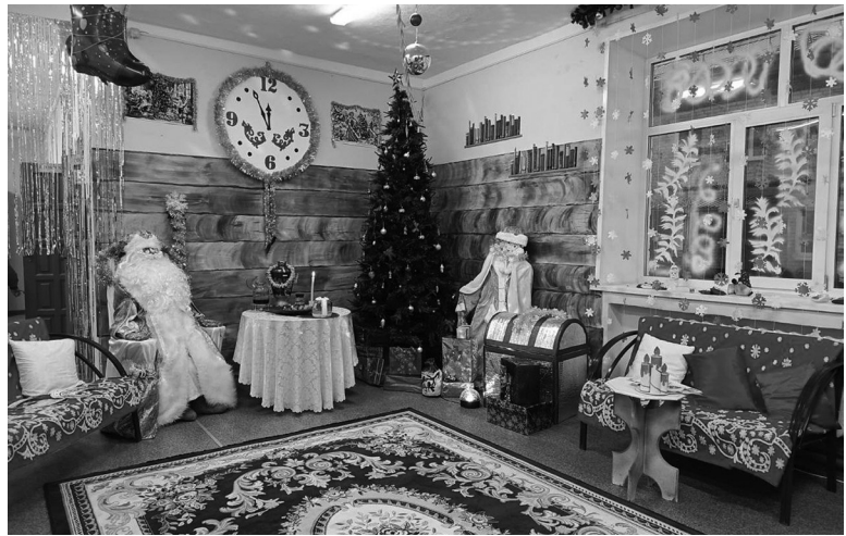
■ На снимке: Новогоднее убранство коррекционной школы-интерната.

Поздравляю всех жителей Сорокинского округа с предстоящими Новогодними праздниками! Пусть у всех всё будет хорошо и отлично. Верьте в чудеса!