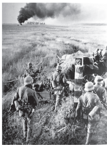
Немецкие солдаты пересекают государственную границу СССР.

Первыми приняли на себя удар пограничники и бойцы частей прикрытия. Они не только оборонялись, но и переходили в контратаки. Целый месяц в тылу у немцев сражался гарнизон Брестской крепости. Даже после того, как противнику удалось овладеть крепостью, отдельные её защитники продолжали сопротивление. Последний из них был схвачен немцами летом 1942 года.