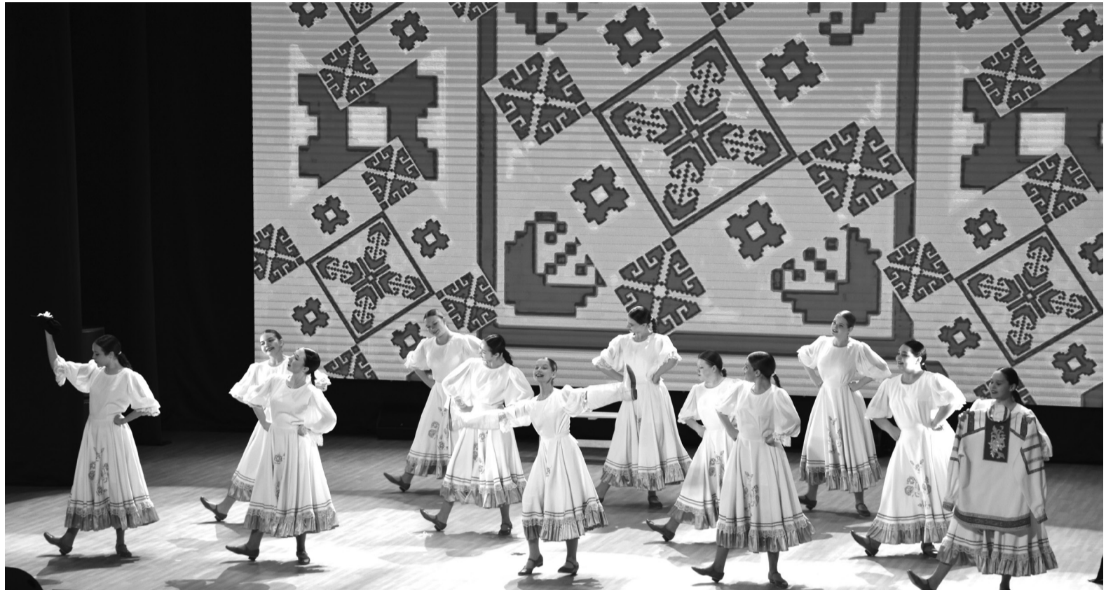
На снимке: творческое выступление танцевального коллектива "Art-dance"

4 МАРТА в 11:00 районный Дом культуры приглашает людей с ограниченными возможностями здоровья на программу «Музыкальное ассорти».