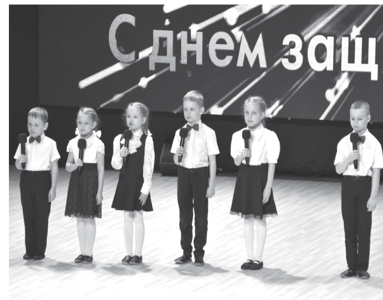
На снимках: фрагменты праздничного мероприятия.