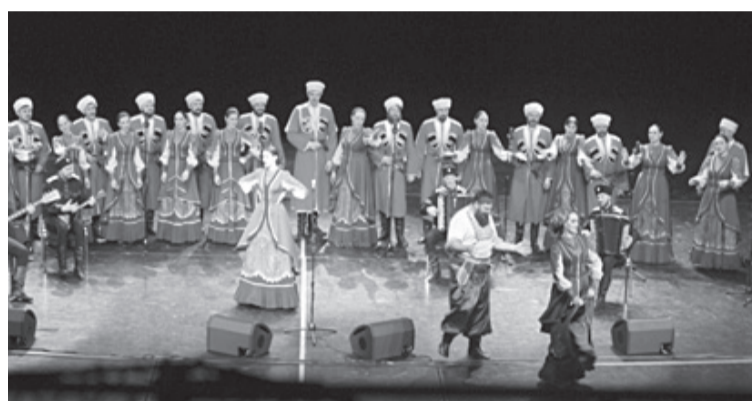
У Кубанского казачьего что ни песня, то шедевр!

За два часа тюменцы увидели около двух десятков высокохудожественных сценических вариантов казачьих народных произведений, вызвавших то слёзы глубокого сопереживания, то весёлый смех. Звучали строевые песни и старинные романсы линейных казаков, песни шуточные и протяжные, походные, лирические, обрядовые, песни,