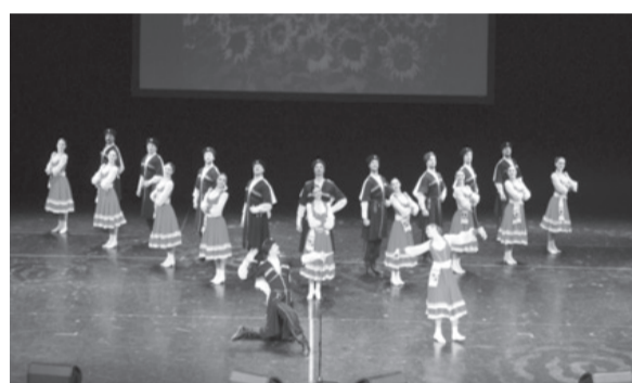
Нет на свете танца краше, когда вдруг казак запляшет

Горячий и радушный приём сибиряков растрогал гостей, в чём они признались под занавес встречи: