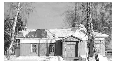
Введенский храм в Сорокино