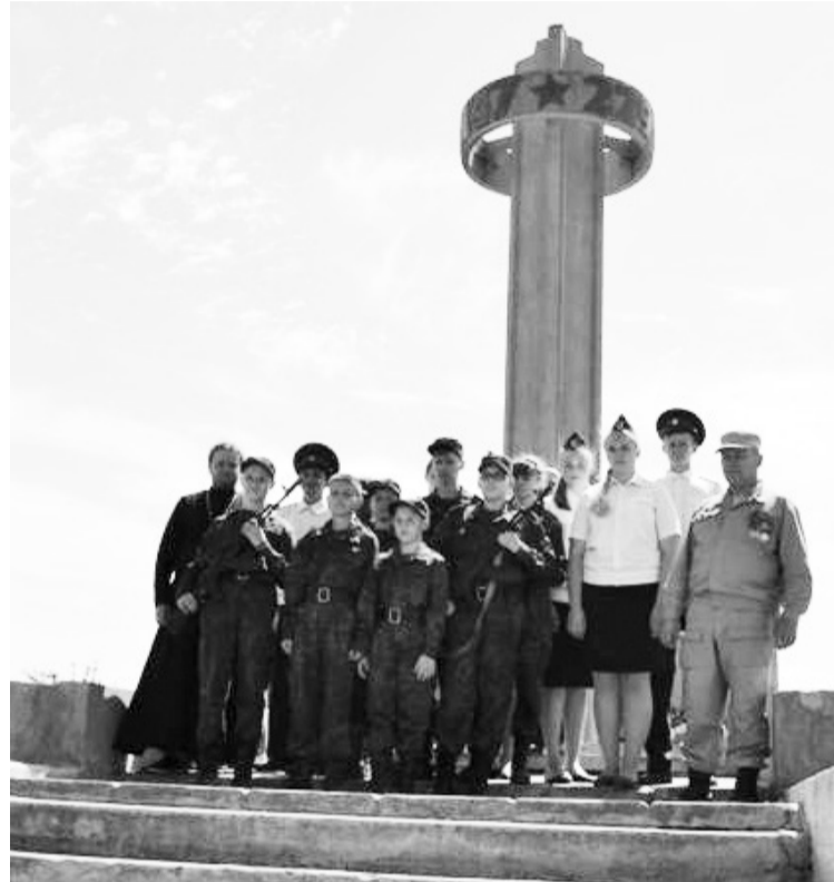
В СУРОВИКИНО У ПАМЯТНИКА ПАВШИМ ВОИНАМ

– В первую очередь удивляют масштабы военных действий, которые там происходили. В музее Ста-