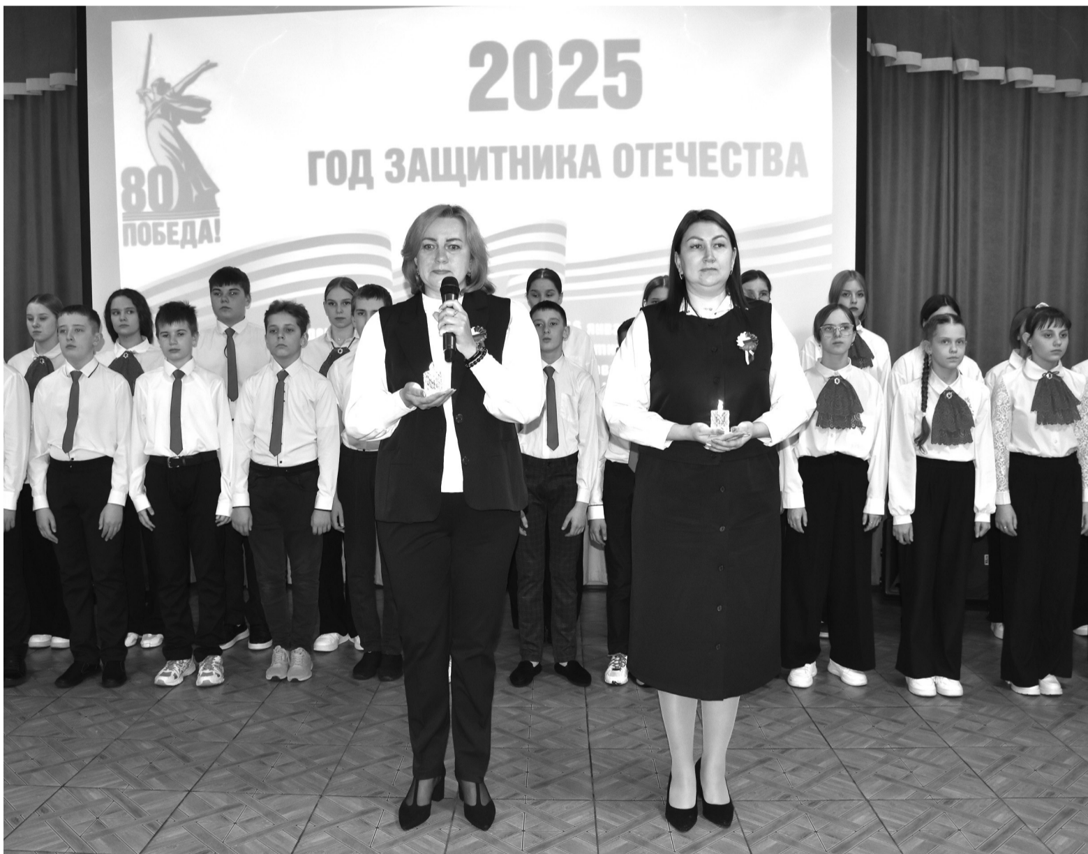
На снимке: творческое выступление коллектива школы №1.

Актуально. В Сорокинской школе №1 торжественно объявлен Год защитника Отечества