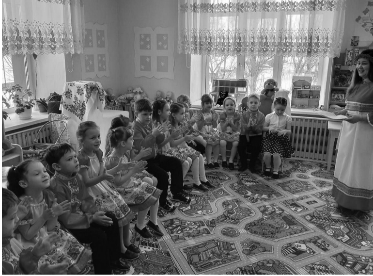
На снимке: фрагмент мероприятия.

Чтобы понять, что означает слово «улица», библиотекарь провела интересную игру. Дети разделились на две шеренги и увидели, как они стоят лицом к лицу, как дома на улице. Это простое объяснение вызвало улыбки и понимание, что улицы — это не просто асфальт и здания, а место, где пересекаются судьбы людей. Затем предложили детям представить, что они находятся на радио. «У вас появилась уни-