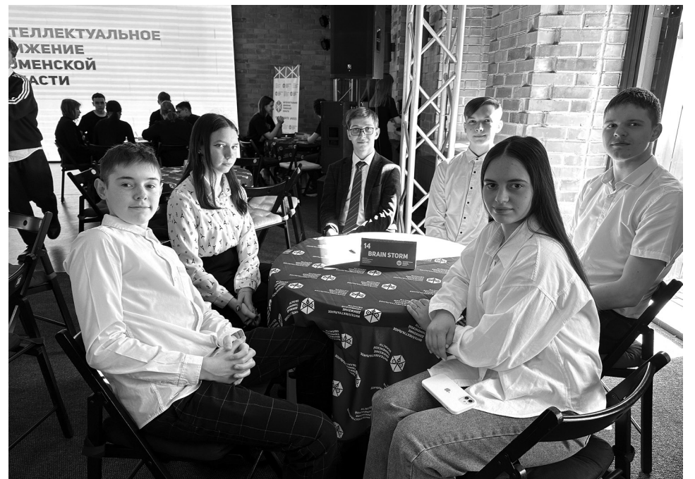
Сборная команда учащихся 10 – 11 классов «BRAIN STORM»

Поздравляем ребят, педагогов и родителей, которые всегда рядом, с достойными результатами! Каждое событие предоставило каждому из вас возможность обогатить свой опыт и поделиться собственными ценными находками, открыть в себе ту глубину творческих способностей, о которой, возможно, вы сами не подозревали! Вы все на своём примере доказали, что вместе мы – сила, ведь семья, по убеждению К.Д.Ушинского, является духовной опорой человека! Согласитесь, трудно это оспорить!