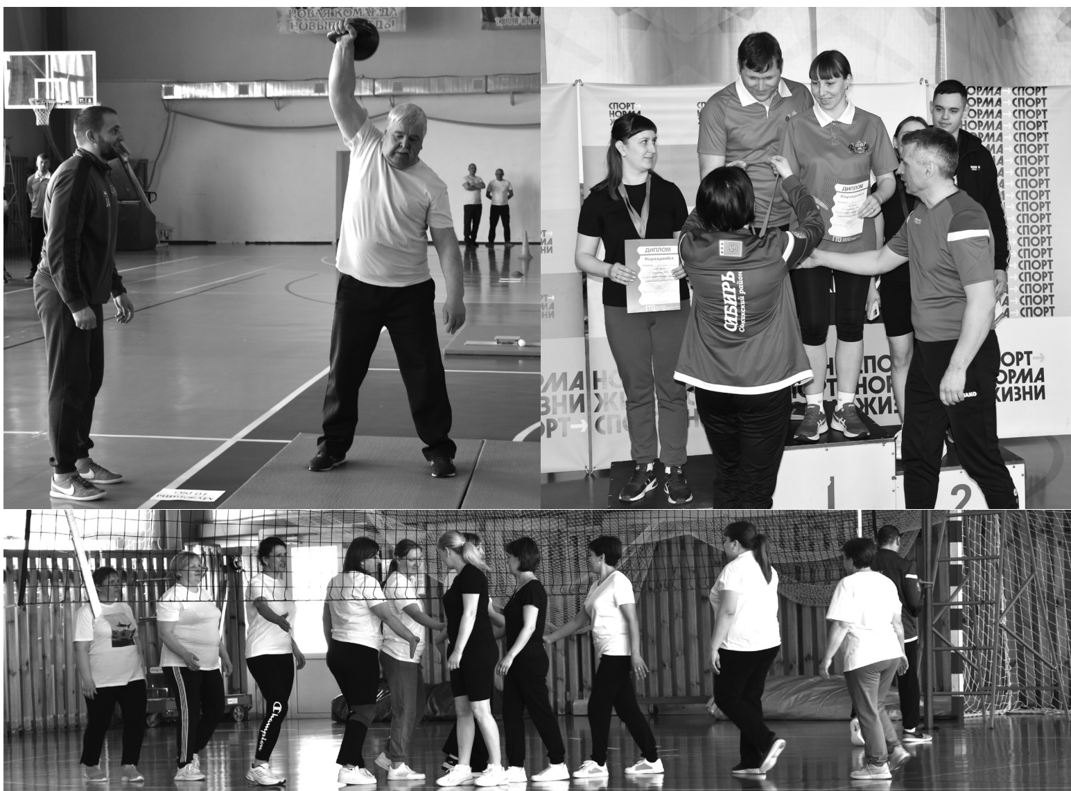
На снимках: фрагменты состязаний