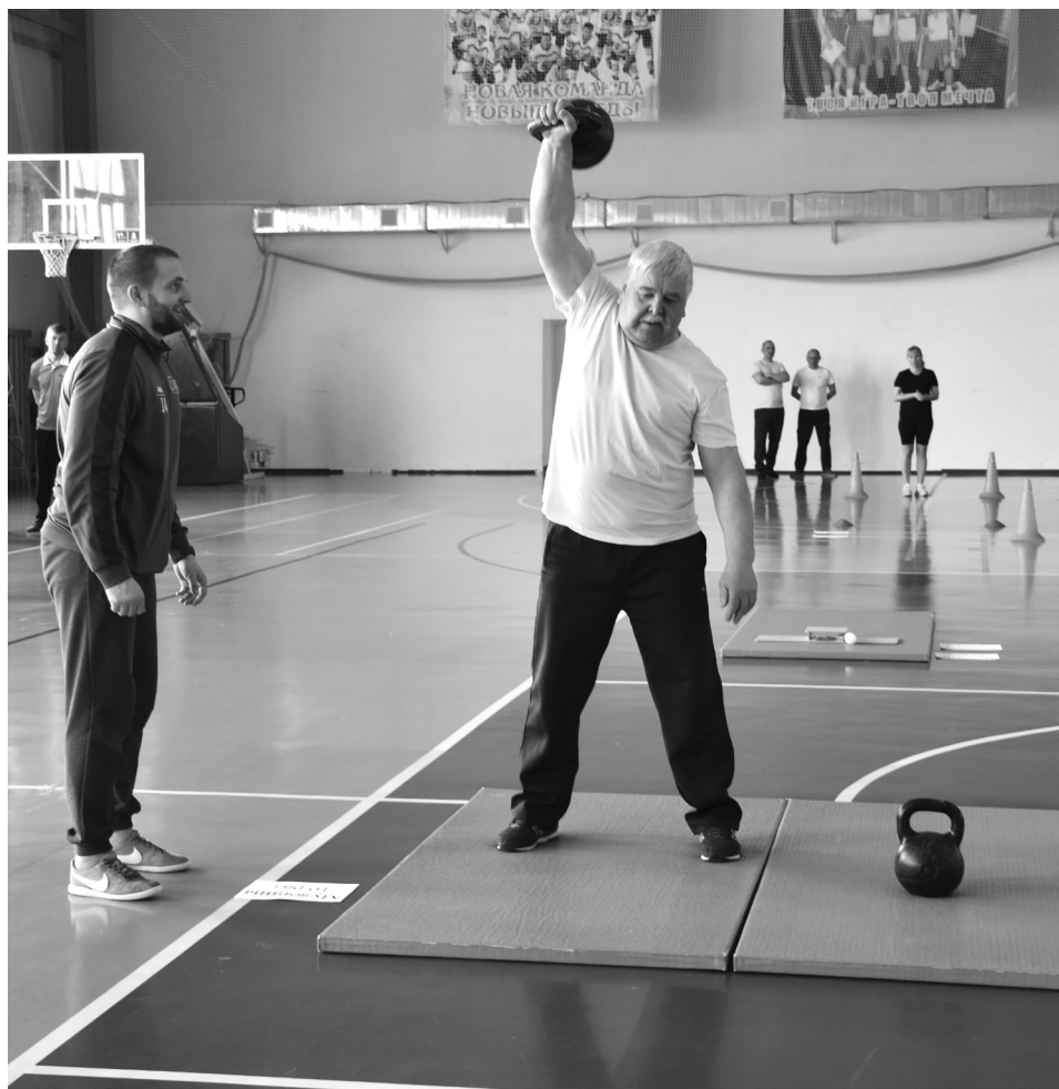
ГТО в районе любят!

В случае, если участник согласен и принимает текущие результаты тестирования, соответствующие серебряному или бронзовому знаку отличия, цифровое заявление подписывается в личном кабинете на сайте ГТО.ru. При этом у пользователя всегда есть выбор: согласиться и поставить галочку либо отказаться и попробовать улучшить свои результаты. Подписывая электронное заявление, гражданин соглашается с завершением у него отчётного периода и прекращением возможности улучшить свой результат до конца календарного года. Благодаря нововведению серебряные и бронзовые знаки будут оформляться и вы-