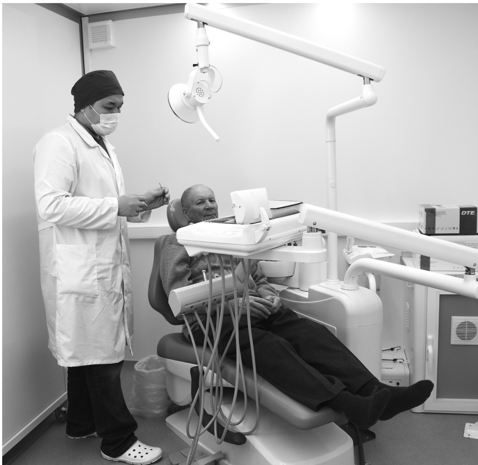
На снимке: на приёме у врача-стоматолога