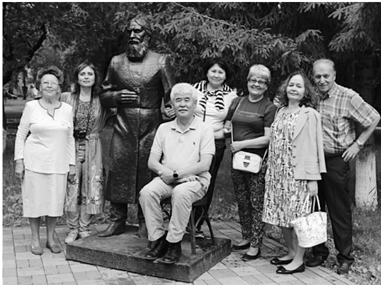
Тюмень. У памятника Распутину

Все члены делегации были заворожены прекраснейшими видами Тюмени и Тобольска. Мы были восхищены тем, как расцвели первые сибирские города, нас рапирала гордость за наших земляков, с каким старанием и заботой они восстанавливают исторические памятные