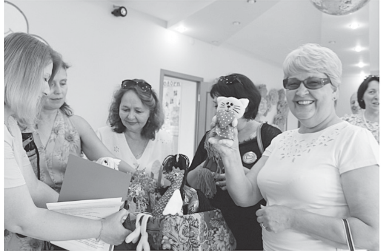
В центре детского творчества

В Сорокинской средней школе № 1 состоялась встреча с выпускниками разных лет и педагогическим коллективом. Нам показали хорошо оборудованные классы и уютную школьную столовую. Директор школы рассказала о работе педагогов в современных условиях, был продемонстрирован видеofilm, посвящённый 75-летию юбилею школы.