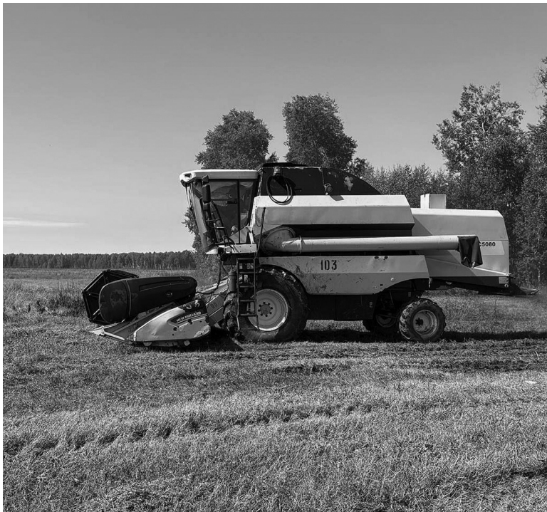
■ На снимке: техника всё ещё в полях