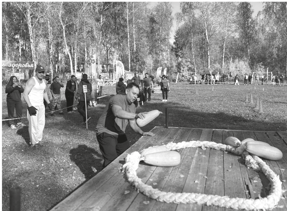
На снимке: фрагменты яркого спортивного мероприятия

В состязаниях приняли участие рекордное число команд, представляющих организации со всего района. На старт вышли: два состава от администрации Сорокинского муниципального района; коллективы Сорокинских школ №1, №2 и №3; воспитатели детских садов №1 и №2; команды учреждений культуры: Детской школы искусств (ДШИ) и Центра детского творчества (ЦДТ); представители важнейших служб: ветеринарной станции, районной центральной больницы, энергетики и спасатели; делегация от Знаменщиковского сельского по-