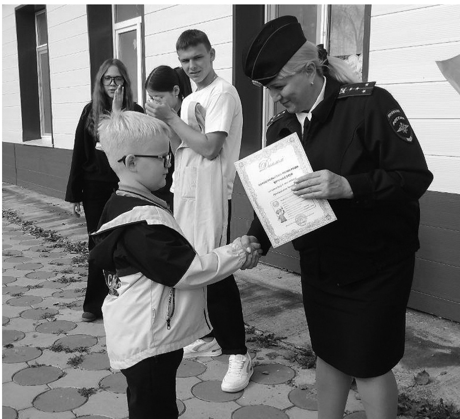
На снимках: Самостоятельных пешеходов теперь стало больше

Безопасность. Первоклассники стали полноправными участниками дорожного движения