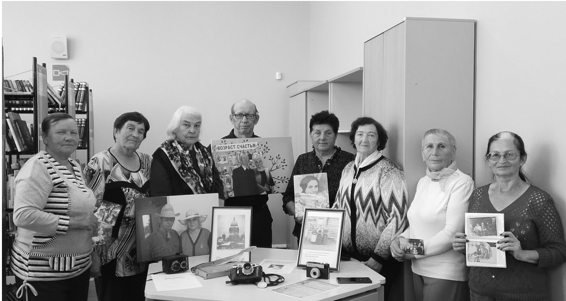
■ На снимке: участники библиотечного клуба "Общение"

Старые фотографии — это не просто изображения, а живые воспоминания, способные рассказать о многом. Они позволяют прикоснуться к прошлому семьи, к эпохам, которые нам знакомы лишь по рассказам близких. Каждая фотография — как ниточка, связывающая настоящее с историей.