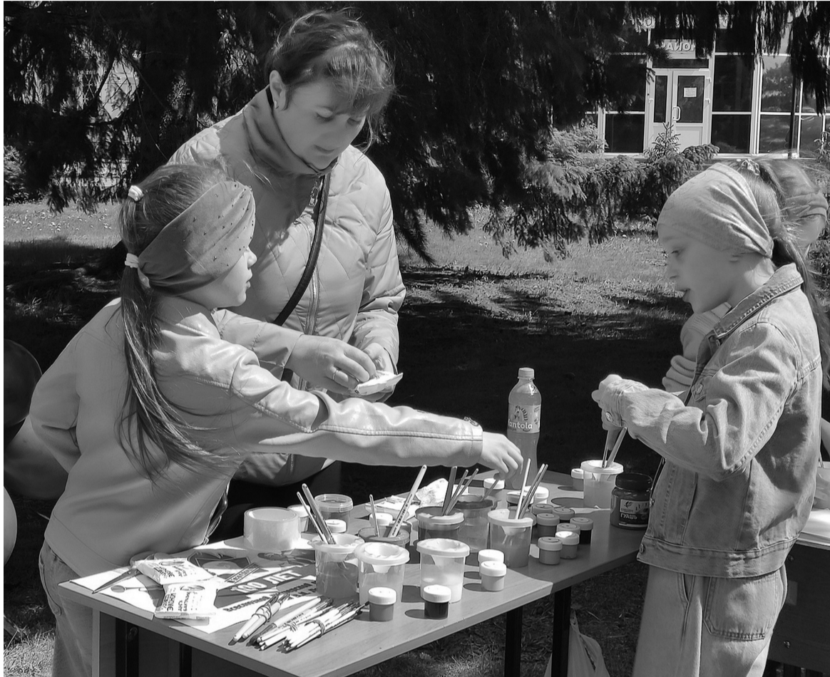
☑ Время, проведённое с родными людьми, бесценно

Если проводить свободное время неординарно, то яркие впечатления обеспечены всей семье.