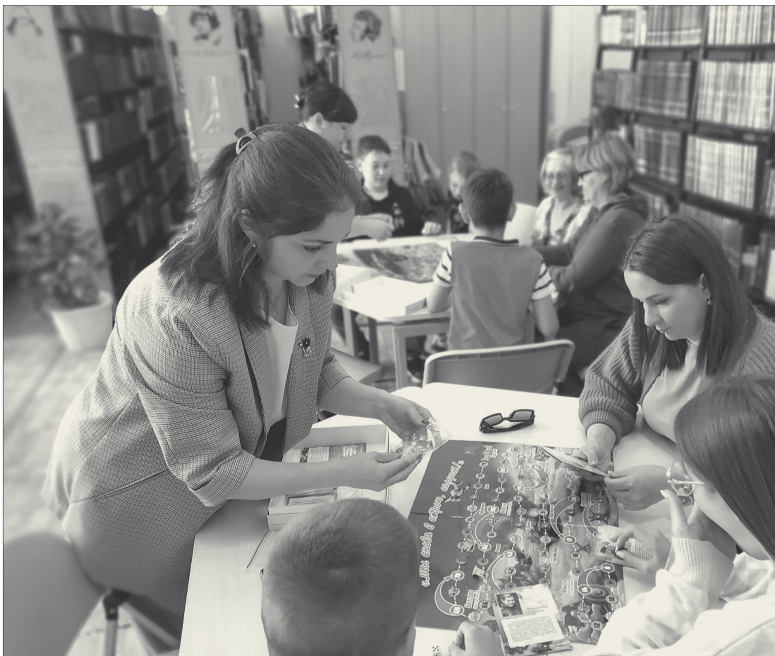
Игра «Ты снова в строю, солдат!» погрузила участников в атмосферу времён Великой отечественной войны

Семейные ценности. Один из лучших способов сплотить семью — проводить больше времени вместе.