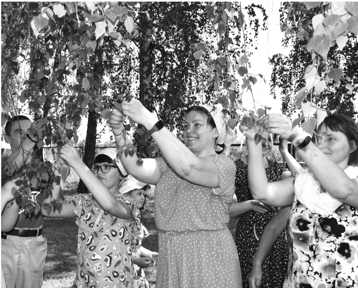
Отмечать День Святой Троицы в Сорокинском районе становится доброй традицией

Православие. Один из главных православных праздников собирает всё больше сорокинцев.