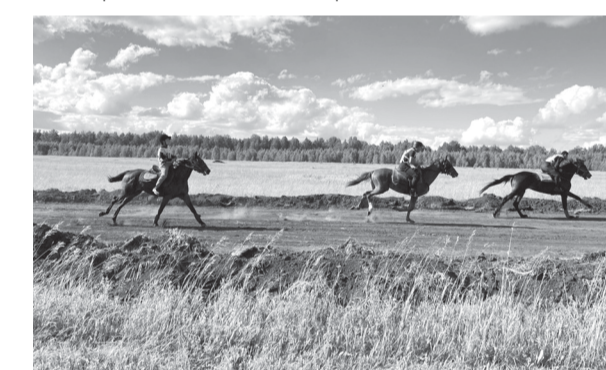
Даже самые маленькие наездники подошли к делу очень серьёзно

Мастера и ремесленники представили на ярмарке изделия народных промыслов