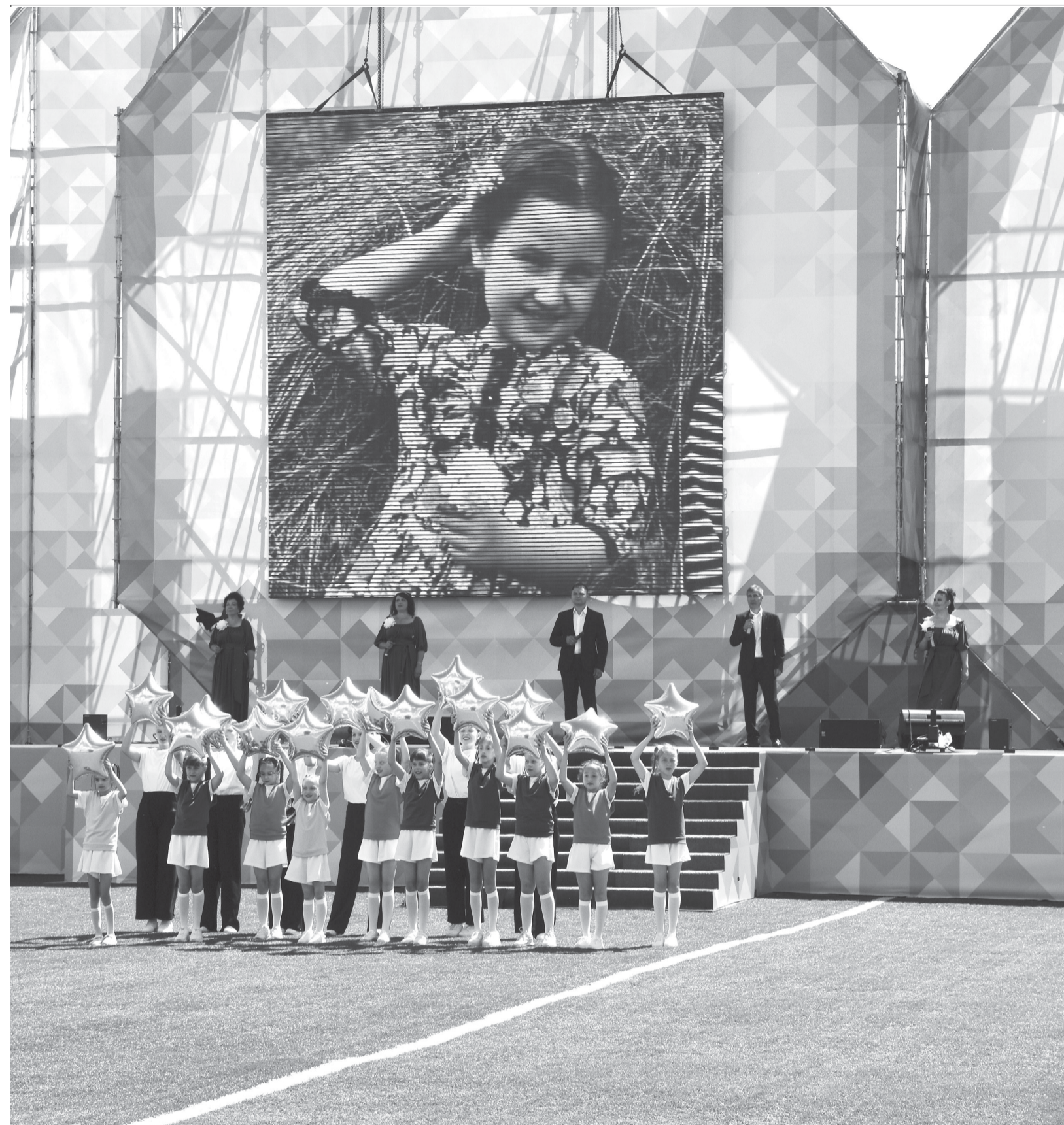
На главной сцене состоялась праздничная программа, посвящённая юбилею района, под названием «Это судьба»