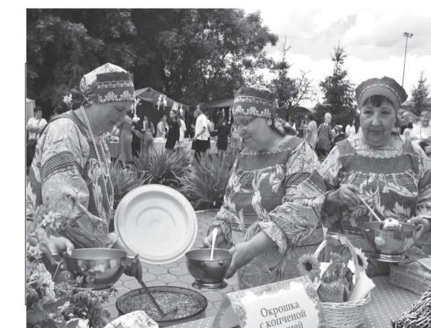
Холодный суп участникам и зрителям мероприятия пришёлся по душе

Грибная, с копчёной курицей, традиционная, со сметаной и без, холодная окрошечка собрала большое количество любителей этого холодного супа и оказалась как нельзя кстати в этот знойный день.