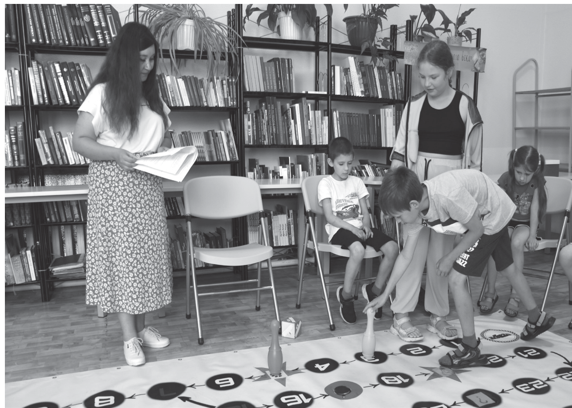
Школьники продемонстрировали хорошие знания флоры и фауны Тюменской области

Дела библиотечные. Отдыхающие в лагере дневного пребывания стали участниками интерактивной игры