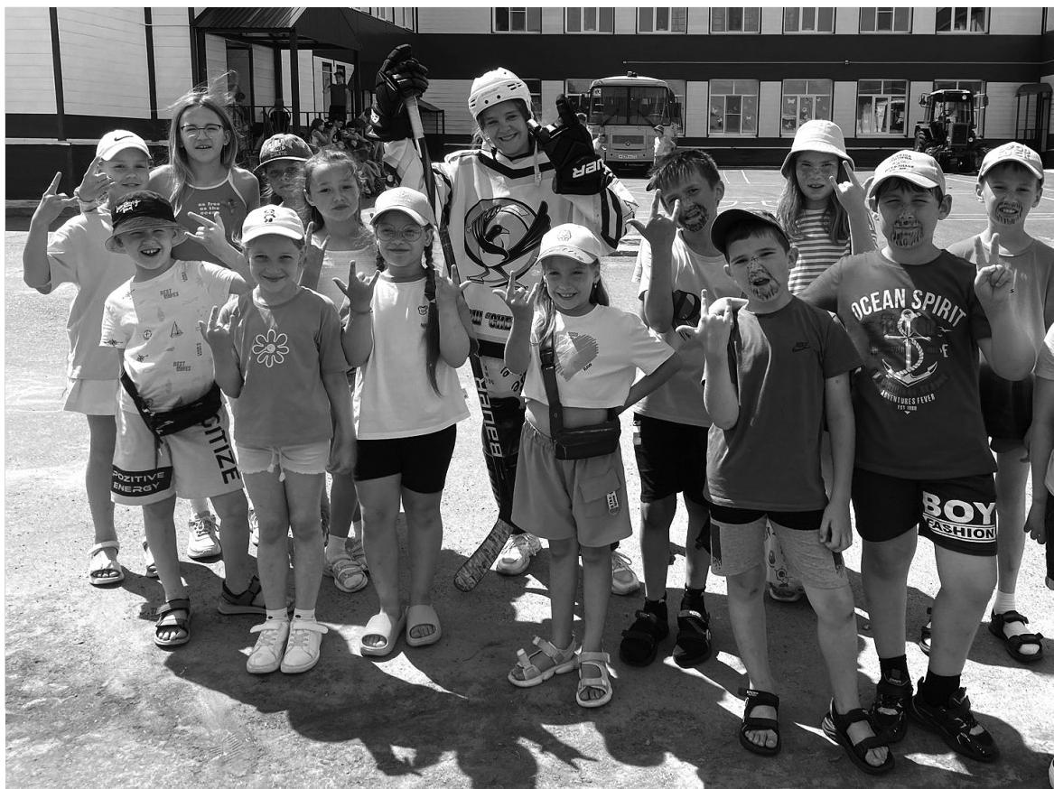
Весело и интересно провести время летом помогают лагеря с дневным пребыванием

Летний отдых. Продолжает свою работу лагерь дневного пребывания при школе №1 "Маршруты лета"