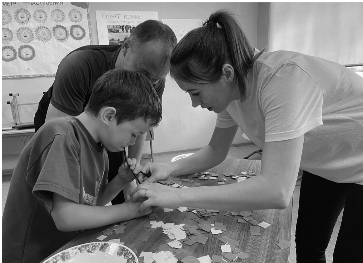
☑ Время, проведённое вместе, является основой сильных и здоровых семейных связей. Этому правила всегда придерживается семья Мягких

Первая площадка «С» – СПЛОЧЕННОСТЬ. Здесь участников ждёт тимбилдинг. Team building в переводе с английского озна-