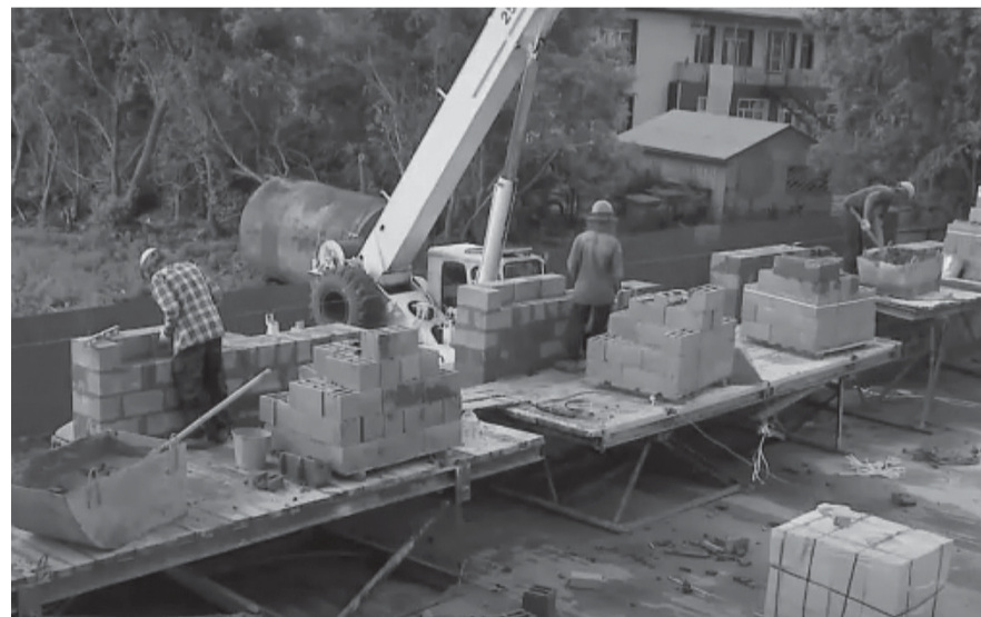
Строительство многоквартирника идёт полным ходом

Когда-то на этом месте стояли два ветхих восьмиквартирника, которые после расселения жильцов снесли. На освободившейся территории решили возвести новое добротное жильё.