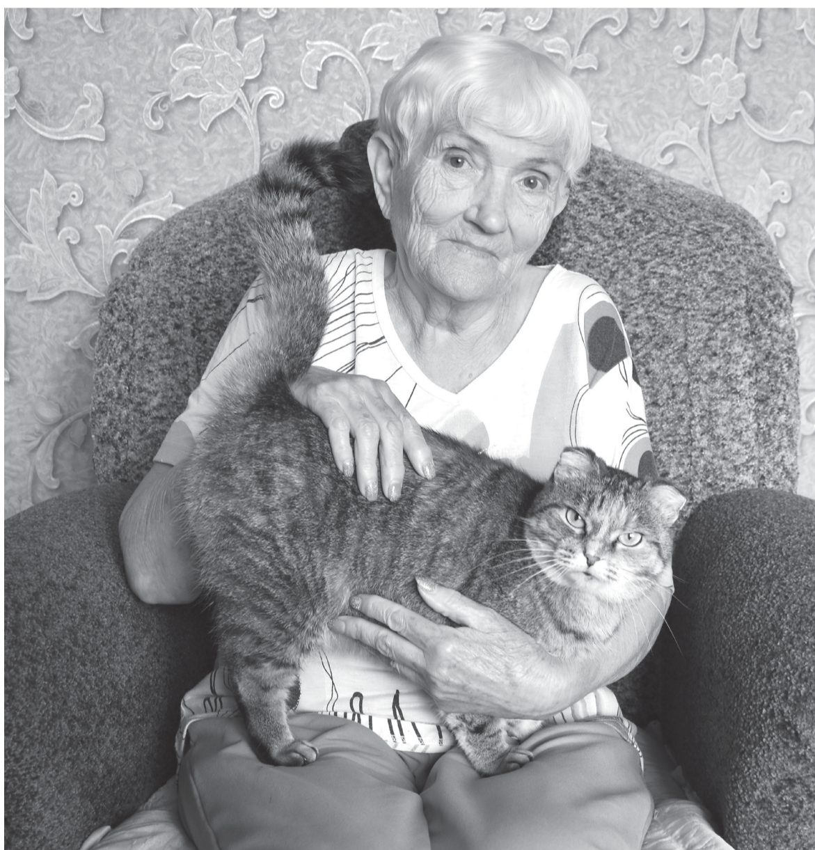
📍 Всегда рядом со своей хозяйкой её любимица – кошка Фрося