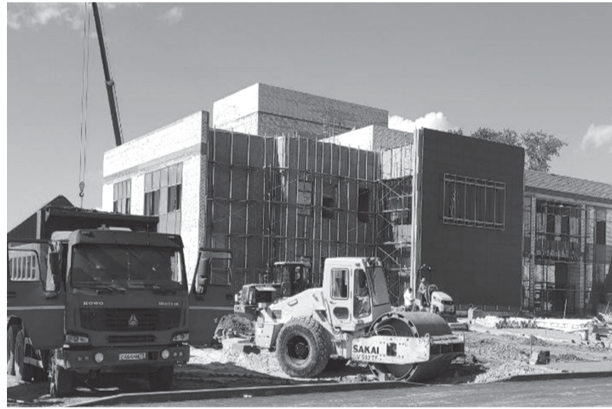
Здание преобразуется очень быстро