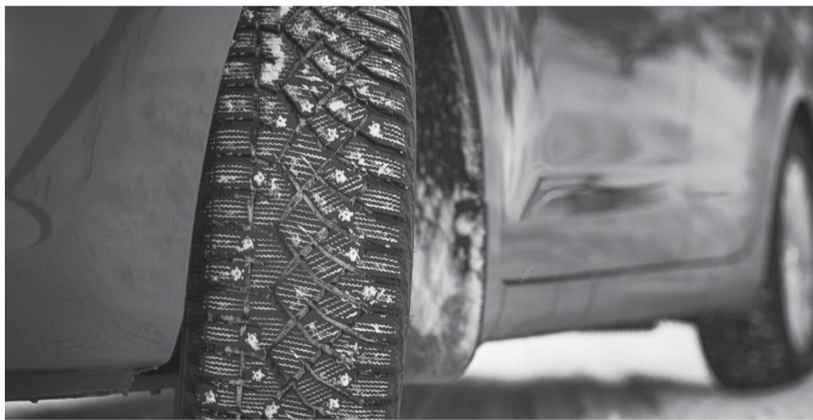
Зимняя резина поможет обеспечить безопасное вождение в условиях низких температур, снега и льда

Для многих из нас граница между «можно поехать пока на летней» и «пора переобуваться» не всегда очевидна. Наступление зимнего сезона часто оказывается неожиданностью для людей. К сожалению, из-за подобной беспечности увеличивается количество аварий в условиях гололеда и большого количества снега на дорогах. Специалисты рекомендуют менять шины у своего железного коня если среднесуточная температура не превышает 5 градусов тепла. В таких условиях летняя резина теряет свои эластичные свойства, соответственно повышаются шансы стать участником ДТП.