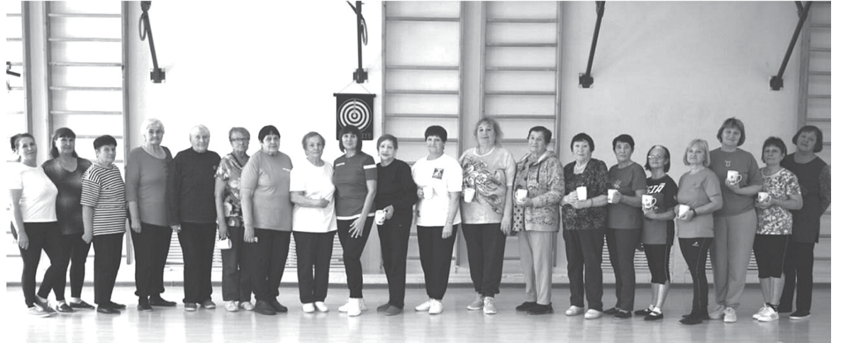
На снимке: фото на память после награждения