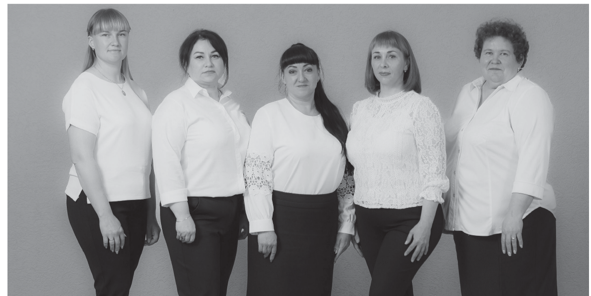
■ На снимке: специалисты районного суда

Для Сорокинского районного суда и его коллектива профессионалов стартовало новое столетие. А это значит, что они продолжают выполнять свою важную миссию в обеспечении правосудия и защиты прав граждан, готовясь к новым вызовам и возможностям в будущем.