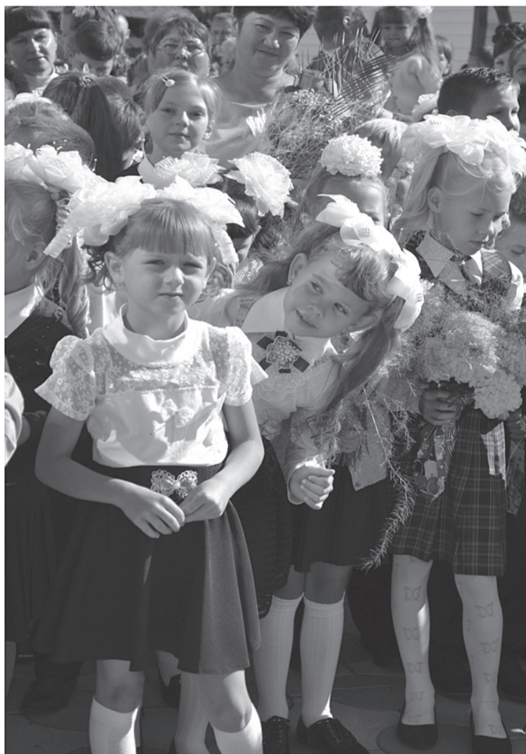
А это второклашки — их уже ничем не испугаешь.