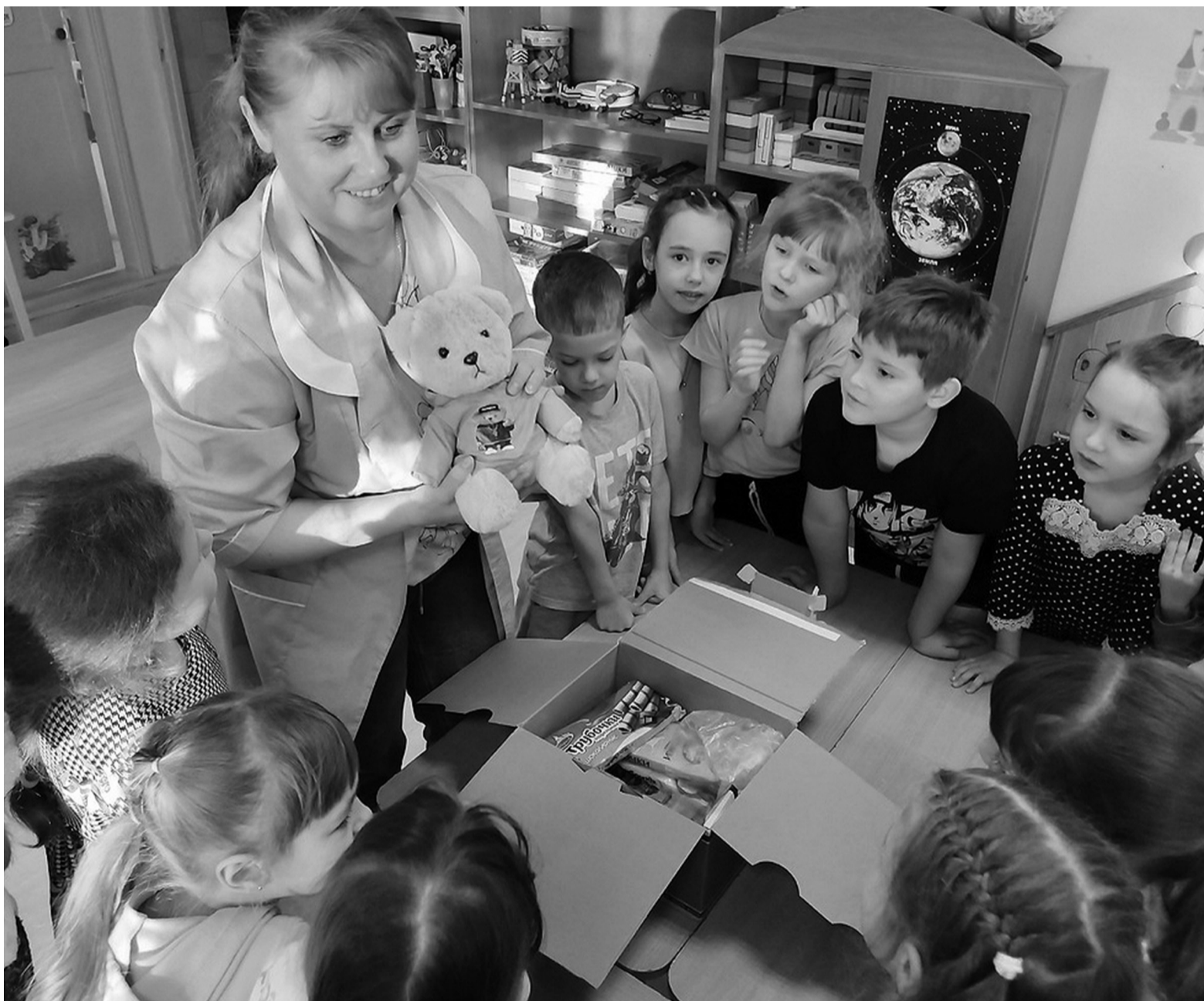
Вот и к сорокинской ребятне пришла посылка от маленьких выборжан

Проекты. Воспитанники детского сада № 1 участвуют в международном проекте