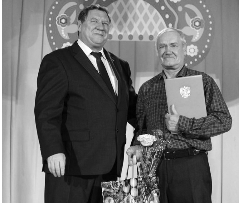
На награждении