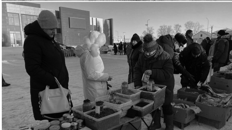
■ На снимках фрагменты ярмарки

Омутинское, Тюмень) 15 индивидуальных предпринимателей. Товарооборот составил более 1 млн.руб. Представлен широкий ассортимент продукции: мясо (баранина, говядина, свинина), мясо птицы (гуси, куры, утки, индюки), сало, масло, сыр, колбасные изделия,