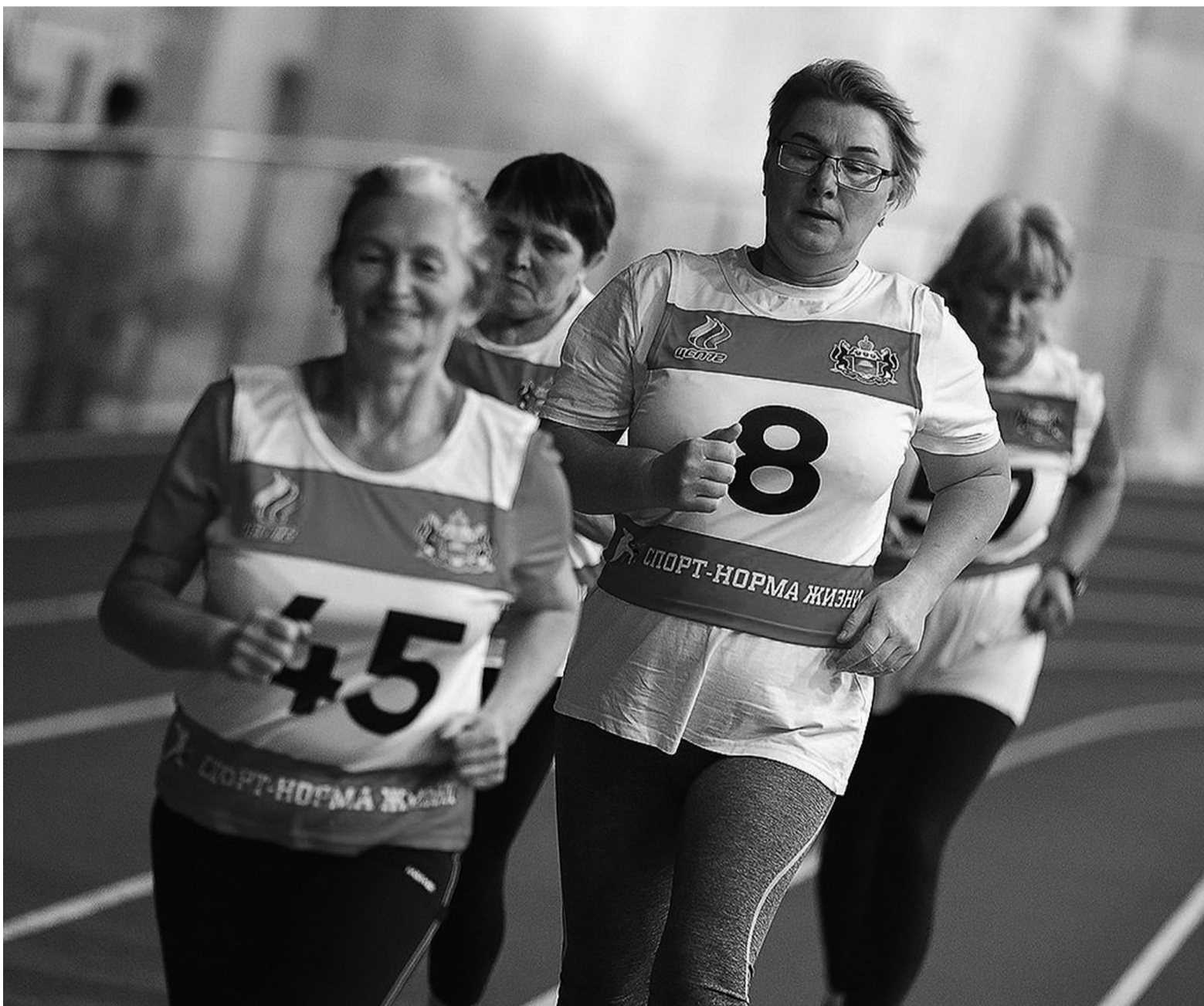
Спорт - норма жизни для многих сорокинских пенсионеров. Они в очередной раз это доказали!

Спорт. В Тюмени завершилась III Спартакиада пенсионеров Тюменской области