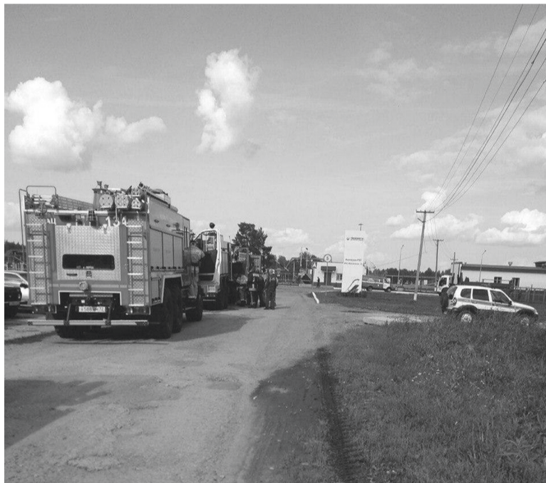
■ По замыслу учений произошёл разлив нефти и возгорание в насосном зале предприятия

По информации ведомства, в ходе учений были отработаны совместные действия пожарно-спасательных подразделений и работников предприятия. Проверены первичные средства пожаротушения, наружное противопожарное водоснабжение и система внутренней пожарной сигна-