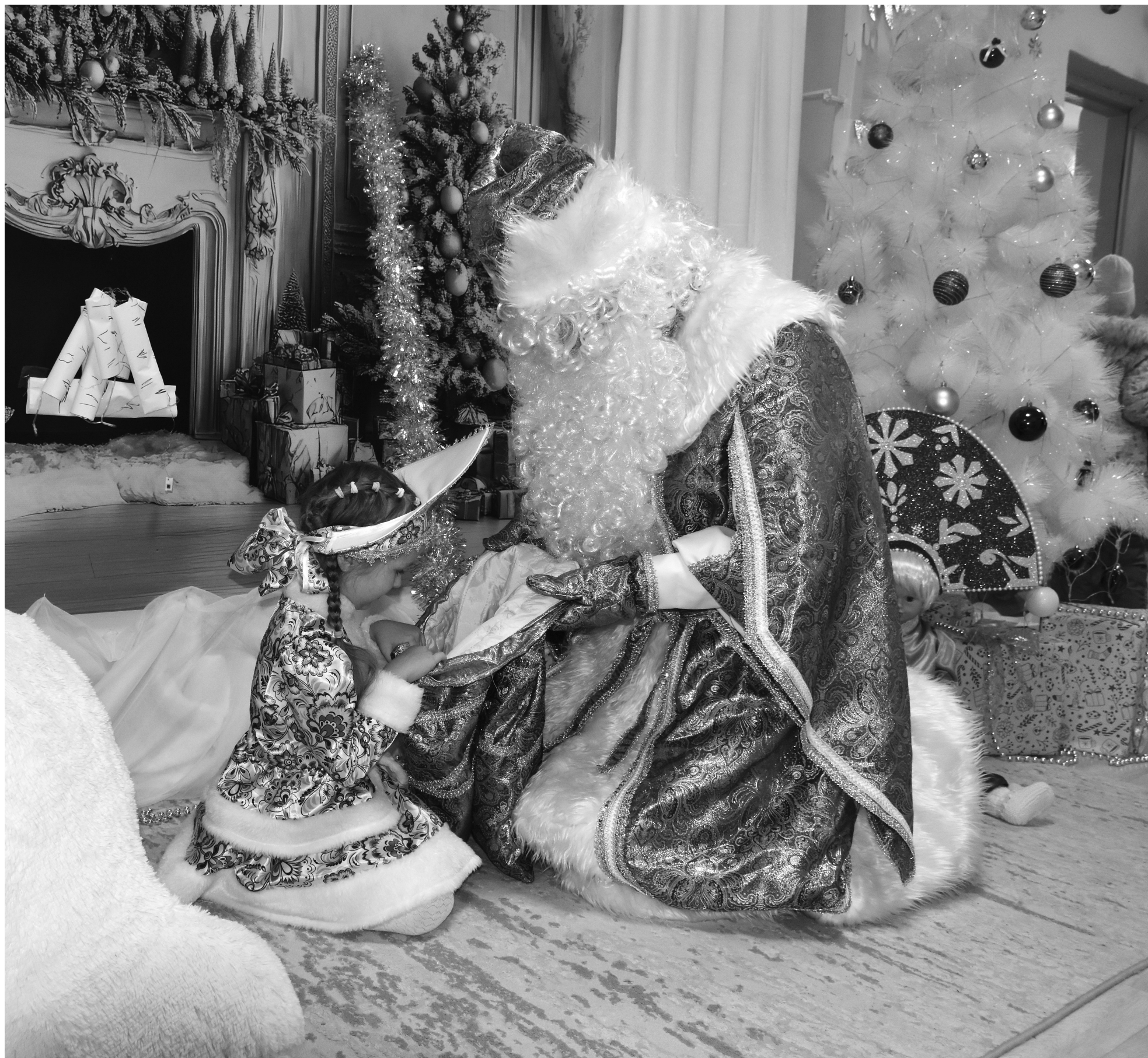
Пусть в этом году главным подарком для всех станет мир во всём мире

► Одноклассники: ok.ru/soroka.rus ► ВКонтakte: vk.com/soroka_ru ► радио Сорокино 103,2 FM