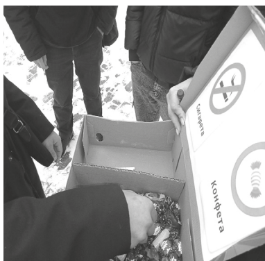
■ На снимке: Все желающие могли поменять сигарету на конфету