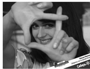
Сибирячка. Как ты красива сегодня!